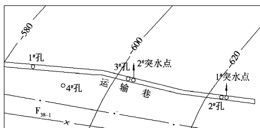
图 3 探查孔布置示意图

2) 钻孔结构要求. 各钻孔开孔直径为 311.15 \text{ mm} ,钻进至第四系地层以下 5 \sim 10 \text{ m} ,下 \Phi 244.5 \text{ mm} 的套管,注浆固结隔离第四系地层,变径为 219 \text{ mm} 和 215.9 \text{ mm} 钻进至 2^{\#} 煤顶板上 60 \text{ m} 左右,下 \Phi 177.8 \text{ mm} \times 8.05 \text{ mm} 的通天套管并固孔,变径为 152 \text{ mm} 裸孔钻进至 2^{\#} 煤底板下 20 \sim 60 \text{ m} 终孔. 设计终孔层位为进入奥灰含水层 20 \sim 45 \text{ m} ,孔深为 800 \sim 900 \text{ m} . 钻进至煤层底板以下一定深度定向造斜,分支孔孔径 127 \text{ mm} ,控制 30 \sim 40 \text{ m} 的范围.